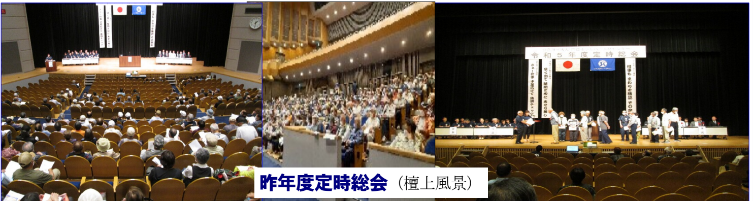
昨年度定時総会 (檀上風景)

この定時総会の準備等でお手伝いをお願い出来る会員の方を募集しています。(お手伝い内容) 受付・自転車整理・場内整理・案内誘導・記念品のお渡しなどです。