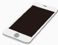
マイナンバーカード読取対応のスマートフォン