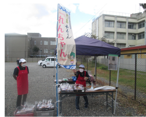
門真蓮根移動販売