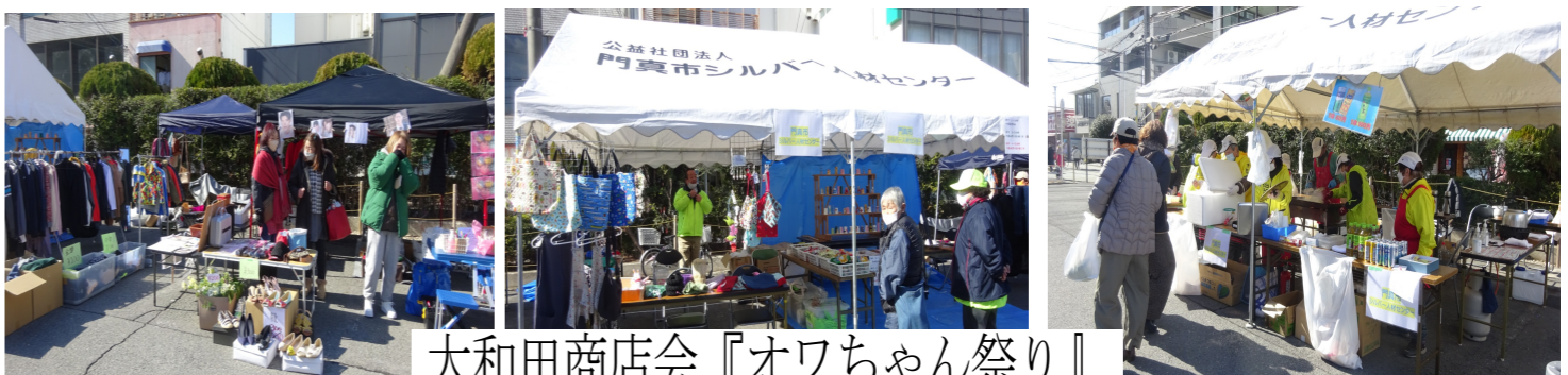
大和田商店会『オワちゃん祭り』