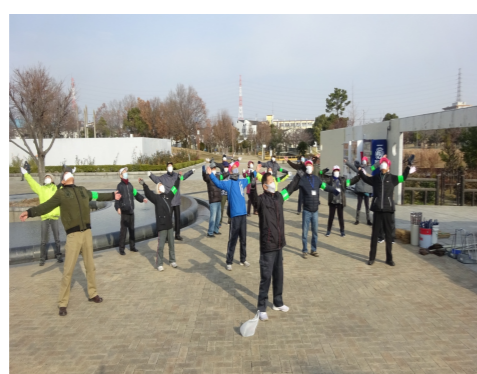
弁天池公園ボランティア清掃始め