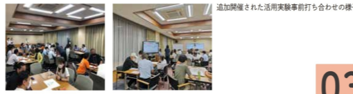
発行：門真市

令和4(2022)年11月19日(土)、旧門真市立北小学校跡地の活用検討を行うための実験「キタショウカーニバル」が開催されました。当日は天候にも恵まれ、600名近い方にご来場いただきました。キタショウカーニバルのプログラムは、これまで行われてきたワークショップと追加で開催された4回の事前打ち合わせを経て、市民有志のみさんによってつくりあげられました。想像以上に多くの方にご参加いただき、これからの旧門真市立北小学校跡地への期待を強く感じる機会だったと思います。活用検討は今後も続いていきます。ぜひご参加ください！