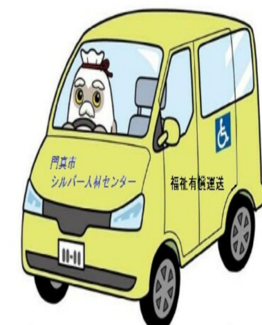
運転が好きで、何より人助けをしたい方