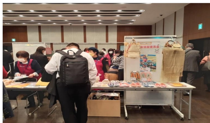
(岡山県浅口市シルバー人材センター出店)