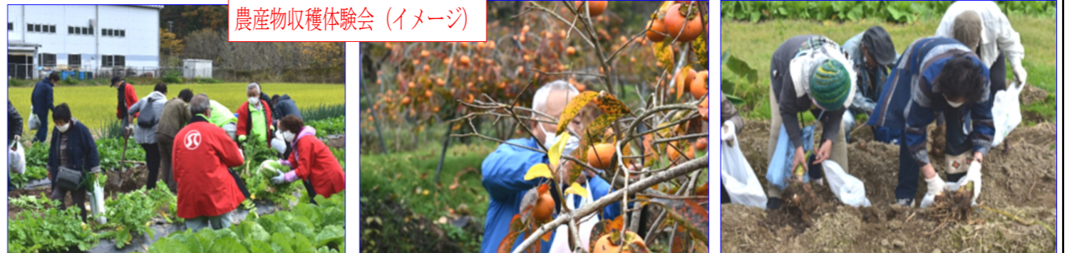
農産物収穫体験会(イメージ)

第11号 秋の普及啓発等イベント事業計画について 第12号 理事の取引に係る報告について 第13号 専門部会及び委員会の報告について (安全適正部会、就業開拓部会、普及啓発部会) その他案件 上程の議案は全て原案とおり議決いただきました。 また、兵庫県養父市のシルバー人材センターにお伺いして、会員の皆さんに収穫の喜びと、新鮮野菜や果物を購入してもらった農産物収穫体験会を開催する計画を発表しました。 開催日時は、11月27日(日曜日)を予定してます。当日は朝から大型バスで門真を出発。兵庫の田舎の澄んだ空気の下、大きく育った野菜を沢山収穫。後は地元食材の贅沢昼食を計画中です。 次号の事務局通信で具体的な参加者募集をしますので、乞うご期待下さい。