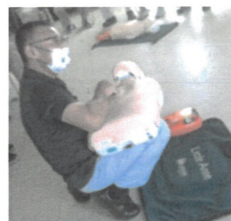
乳幼児の対応を説明