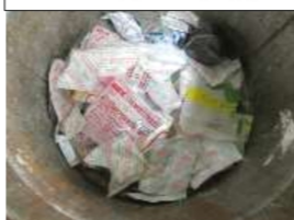
ラインから出てきた乾燥剤

食品トレーにくっついてる乾燥剤はキッチンと取って、一般ごみで捨ててや！(^_^)/ よろしく頼みます！<(_)_>