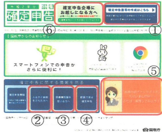
【確定申告特集ページトップ画面】