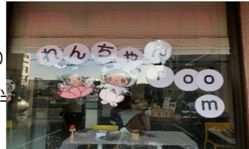
子ども達が早く来て準備を手伝ってくれました😊

内容: 『折り紙教室』 日時: 令和2年2月19日(水)16:00~17:30 場所: 喫茶チエブクロー 対象者: 小学生 (低学年以下は保護者同伴) 参加人数: 10名 ボランティア: 5名(会員以外1名)