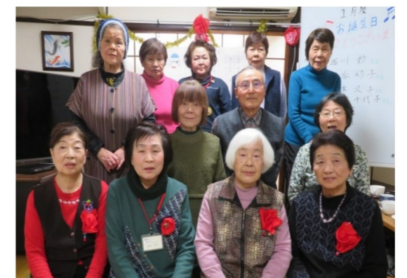
1月のお誕生日風景