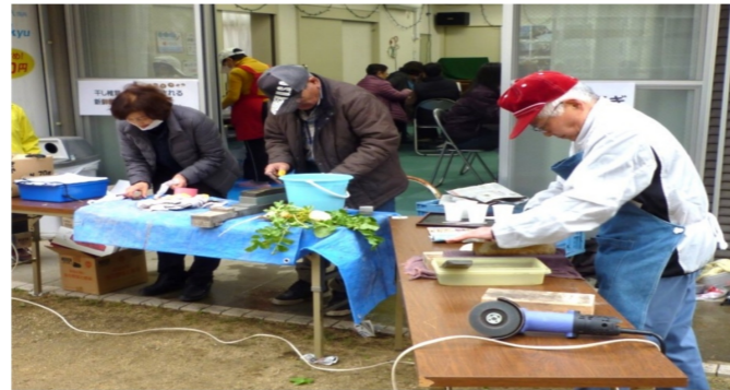
御堂自治会館出前便利やDay