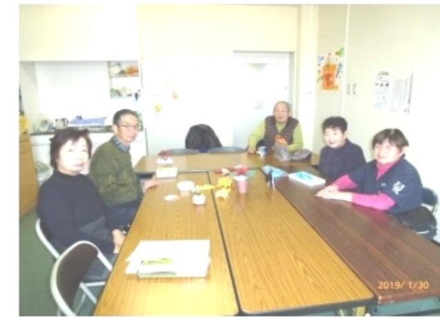
わいわいクラブ仲間のみなさん