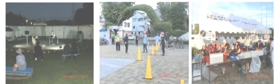
ステージではコンサートも開かれました シルバーの会員さんも自転車整理や飲食店で大活躍されました