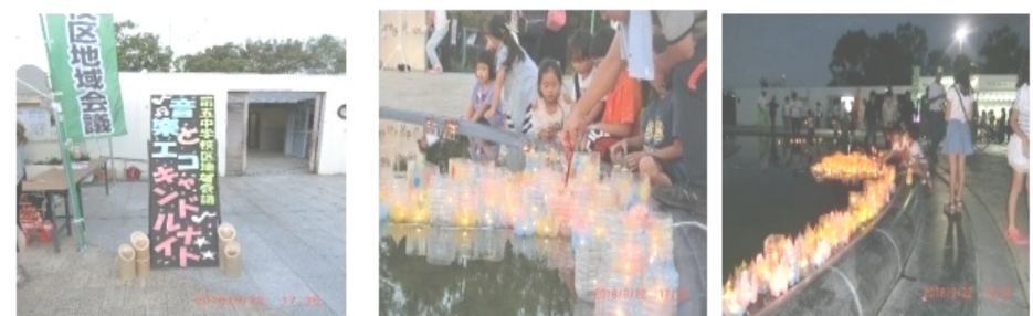
本部前のおしゃれな看板 子供達が楽しそうにケヤキ噴水にキャンドルを浮かせてました