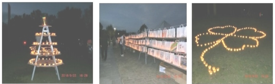
風の塔目に設置されたキャンドルタワー 中央通路に展示された子供たちの作品 芝生広場に作られた四つ葉のクローバー