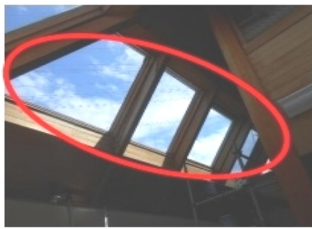
【天井は遮光フィルムを貼る】