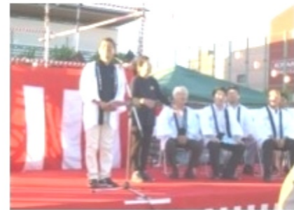
我、センター和副局長も、祭り実行委員長として、「各地で大災害の復興中ではありますが、門真市はこれから地域のつながり、助け合い」を力強く挨拶されました。