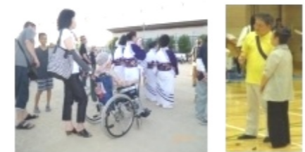
70歳代女性3人組み 近いので一度帰って ゆかたに着替えて また踊りにきます。昨年も楽しかったので、今晚も楽しみ！ 櫓が中央でよかった。