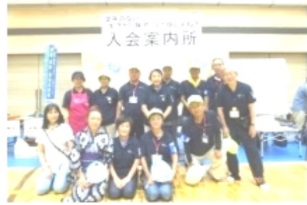
総合体育館ではシルバーの普及啓発ブースを設け、写真の皆さんに奮闘して戴きました。またグラウンドでは、祭りのうちわの配布も行いました。