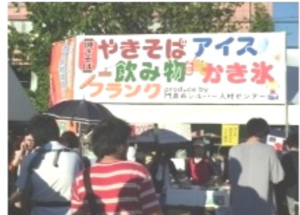
恒例のイベント委員会の出店には、大勢の列が出来て、汗拭く暇もない状況。テントの中は40度超え。準備段階から最後の片付けまで、本当にお疲れ様でした。次回もよろしく！