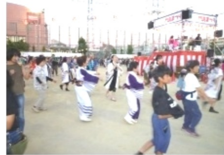
本日の入場は、4万9千人と、公式発表