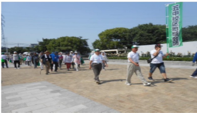
元気よく弁天池公園を出発