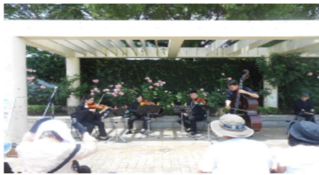
まちかどまちなかコンサートも実施され大いに盛り上がりしました