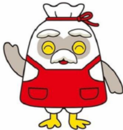
シルバー イメージキャラクター 『チエプクロー』 ～エプロン～

○将棋サロンは、第1・第3(木曜日) 10:00~15:00です。ドシドシ参加してください。