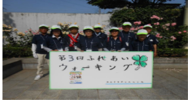
【シルバー人材センター スタッフ】