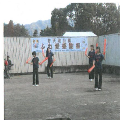
【ステージで踊る子供たち】