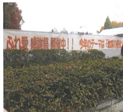
【公園南出入口にテーマを掲示】