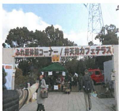
【ふれ愛コーナー/カフェテラス入口】