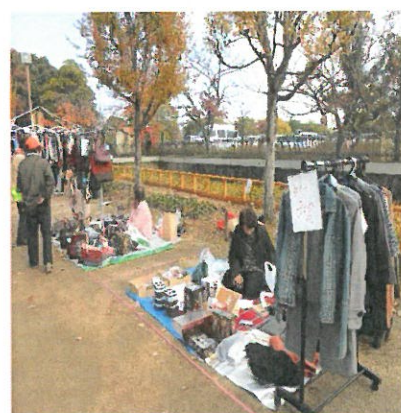
【フリーマーケットも数多く参加頂きました】