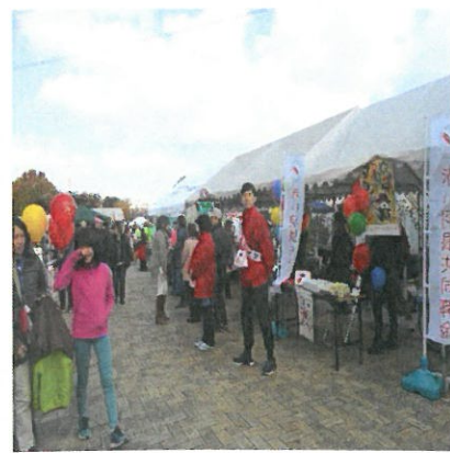
【園内は大変な賑わいでした】