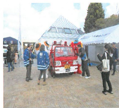
【多くの団体様にご協力頂きました】