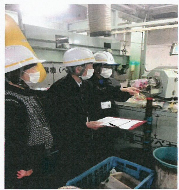
4月5日（水）門真市クリーンセンターにて